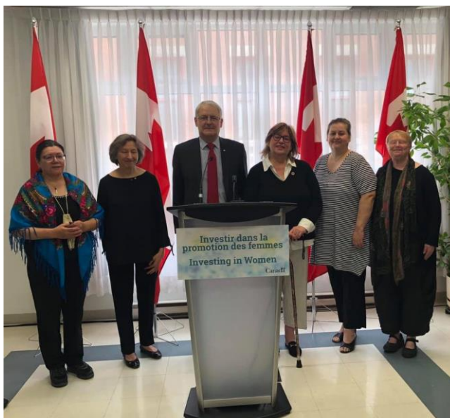
Les récipiendaires du volet québécois du Programme lors de l'annonce publique le 31 mai 2019, à Montréal.

Le projet a obtenu un soutien financier de 1 M$ sur une période de 5 ans (2019-2024) de la part du gouvernement fédéral dans le cadre du Programme de financement de la lutte contre la violence fondée sur le sexe du ministère de la Femme et de l'Égalité des genres.