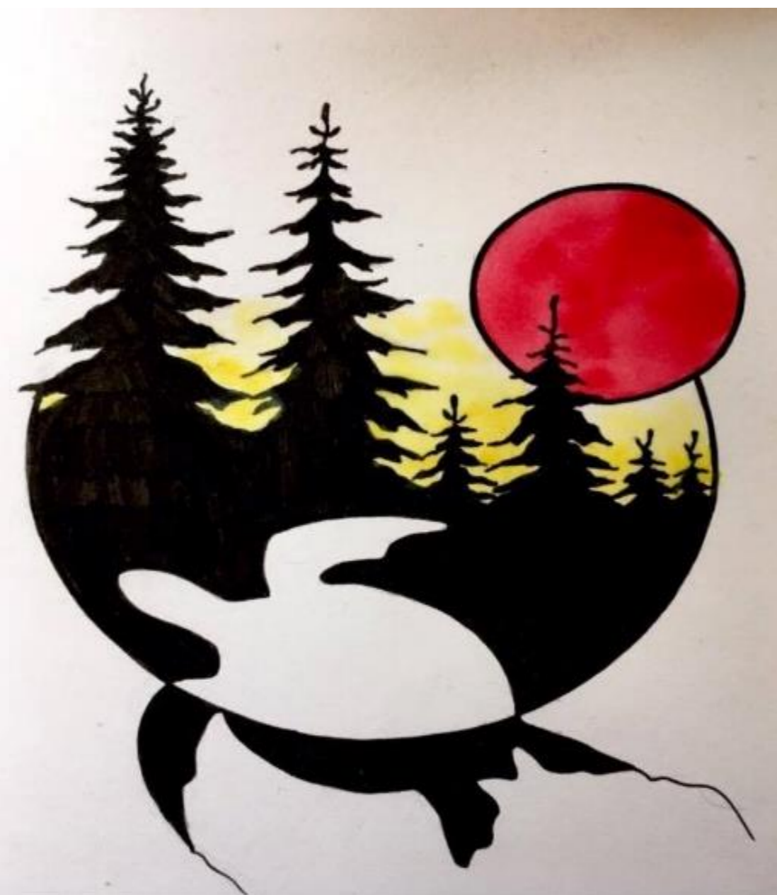
Futur logo du Regroupement des Étudiants Autochtones Mikinakw (signifiant « tortue » en atikamekw) du CRLJ

D'un côté, l'école est un agent de colonisation, de contrôle et d'assimilation; d'un autre côté, l'éducation est au cœur des luttes afin de reprendre le contrôle de leur existence en tant que nation.