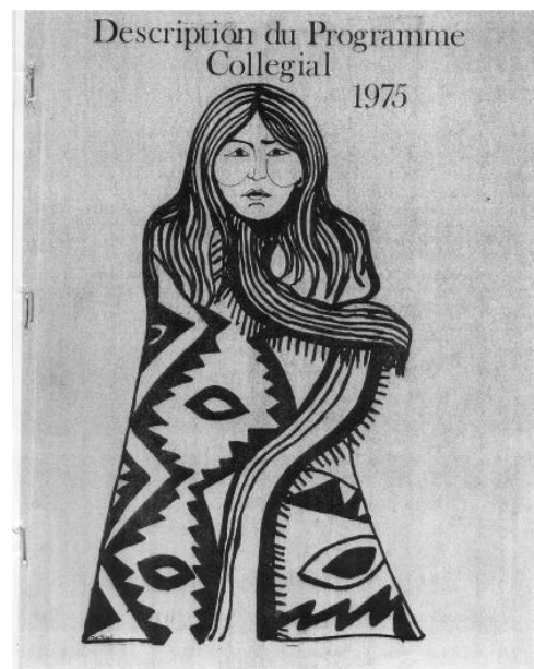
Brochure publicitaire illustrée par Georgette O'Bomsawin