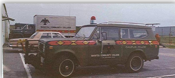
Voiture de police du Collège Manitou