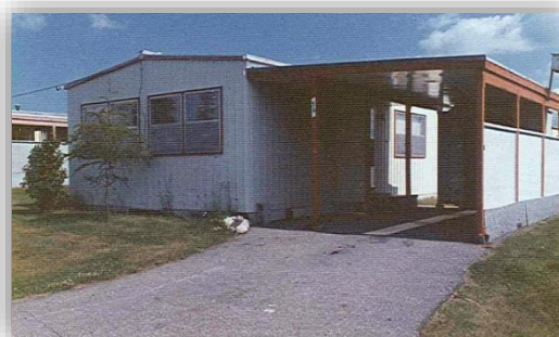
Une des maisons de la communauté du Collège Manitou