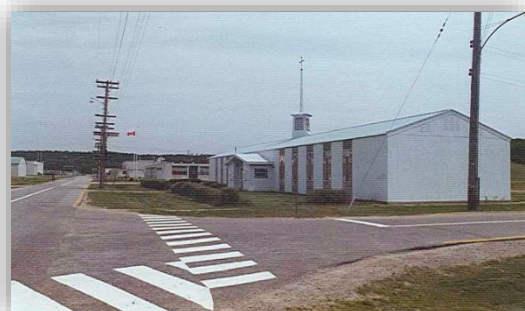
La chapelle du Collège Manitou

Le Collège fut installé à La Macaza, dans les Hautes-Laurentides au Québec, sur l'emplacement d'une ancienne base militaire américaine passée sous autorité canadienne et louée annuellement pour la somme d'un dollar. En 1972 et 1973, l'Institut transforma ces locaux en salles de cours, ateliers, bibliothèque, studios d'enregistrement, imprimerie et chambre noire. Le site incluait également un centre sportif avec une piscine et des terrains de sport. Des maisons préfabriquées pouvaient accueillir les étudiants et leurs familles, et des services de restauration étaient mis à leur disposition. Avec son propre bureau de poste et son propre service d'urgence, le Collège ressemblait tout à fait à un village. Après sa fermeture en 1976, il fut transformé en prison fédérale.